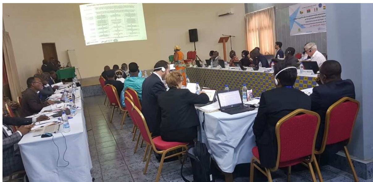
Atelier de lancement du Projet Volta (VFDM) à Abidjan, Côte d'Ivoire