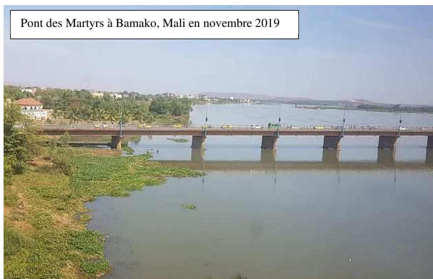
Pont des Martyrs à Bamako, Mali en novembre 2019

Renforcement de la résilience climatique : des actions pilotes, portées par les jeunes hommes et femmes dans le cadre du projet TFTC, ont contribué à