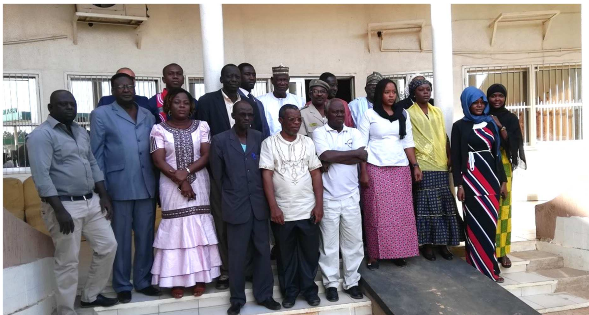
Atelier de validation du plan national sécheresse au Niger