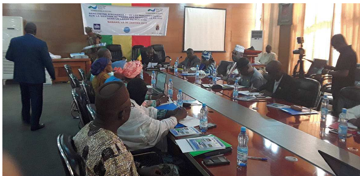
Atelier d'échanges avec les parlementaires maliens par le PNE Mali