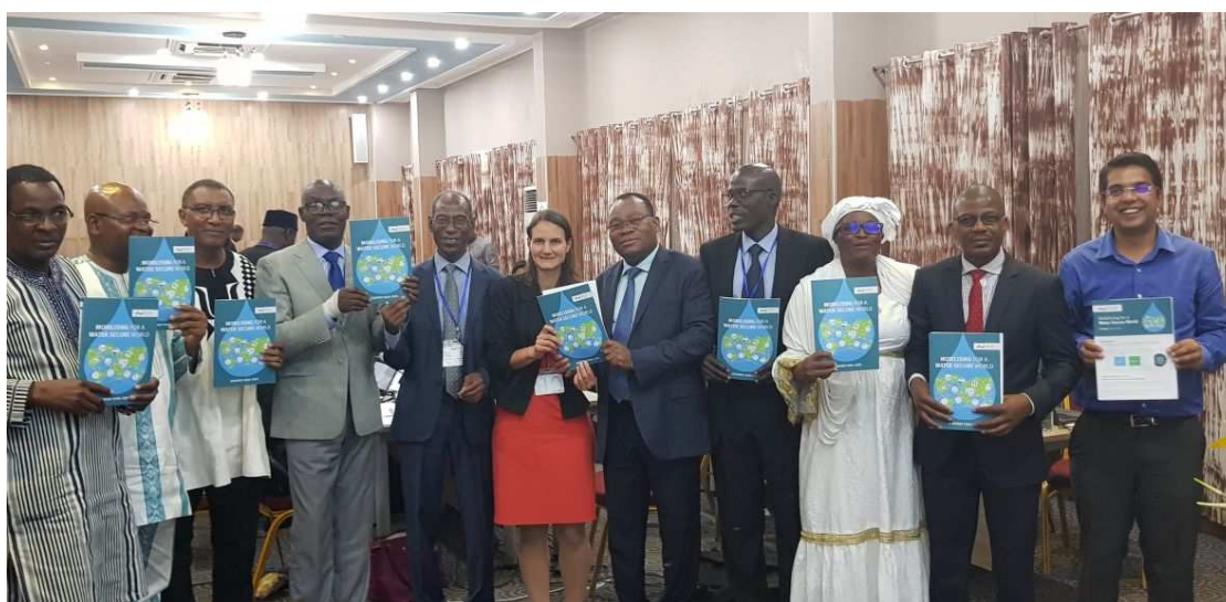
Lancement de la Stratégie 2020-2025 du GWP, le 26 septembre à Ouagadougou