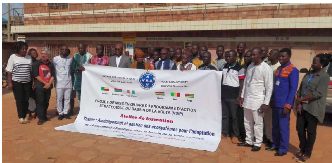
Formation des OSC de l'ABV dans le cadre du VSIP à Natitingou, Bénin