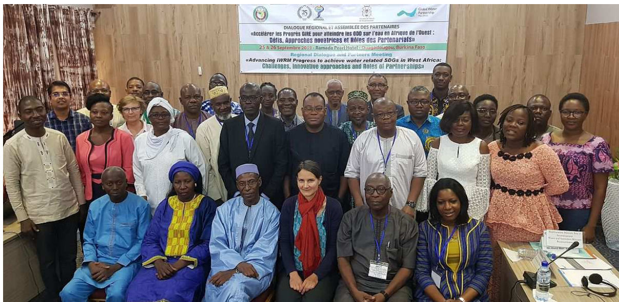
Assemblée des Partenaires du GWP-AO, septembre 2019 à Ouagadougou