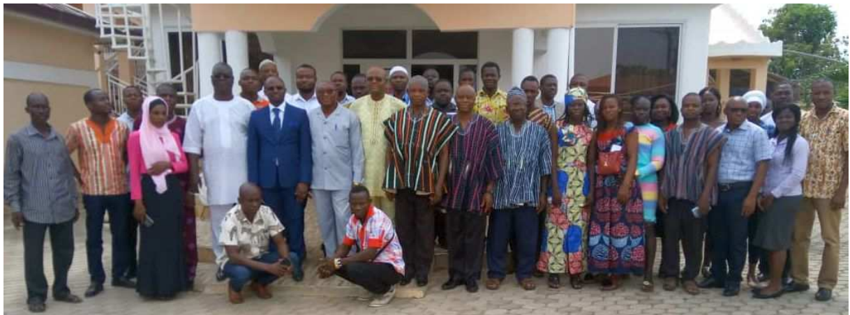
Atelier de formation des OSC de l'ABV à Wa, Ghana

Cette approche vise à intégrer les initiatives en matière de sécurité en eau aux actions de développement à travers les six domaines thématiques. L'objectif est que le programme d'action mondial, de mise en œuvre de la Stratégie 2014-2019 du GWP pour le développement, reflète l'importance de la sécurité en eau pour atteindre les objectifs de développement humain.