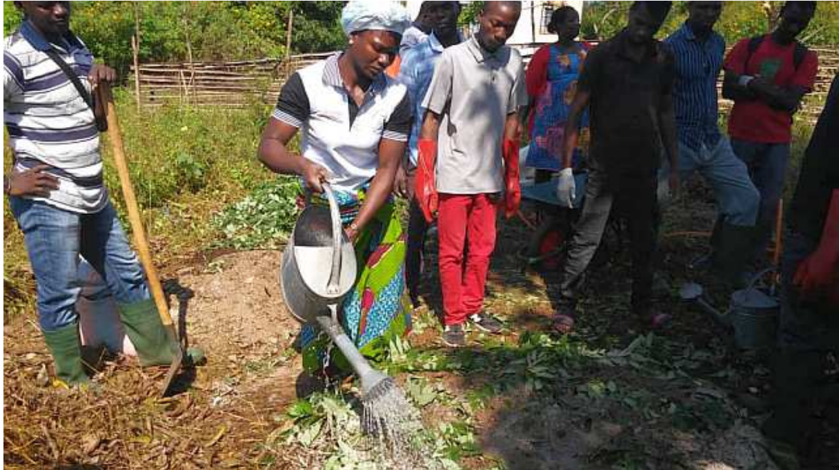
Photo 1 : Formation des jeunes aux techniques de compostage à Dany Apéyémé (Togo)