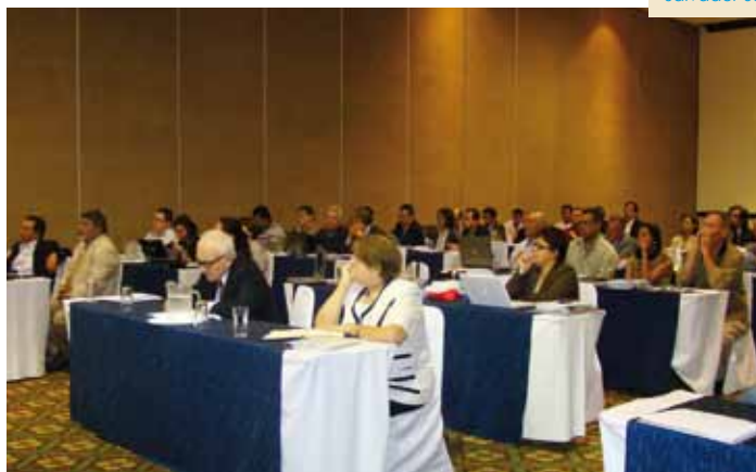
Taller regional sobre el agua y el cambio climático. El Salvador 08/2011

Las instituciones que se comprometieron en la elaboración del informe sobre el estado de los embalses tendrán la oportunidad de participar en una capacitación sobre el tema a inicios del año 2012, como una forma de contribuir al fortalecimiento de sus capacidades y al establecimiento de una red de expertos que pueda apoyar en la identificación