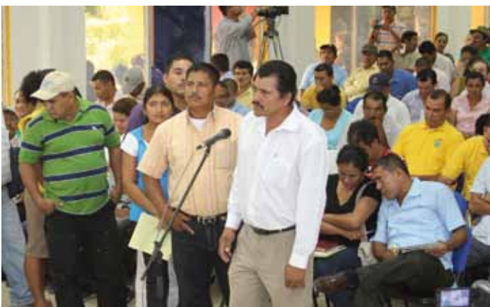
Foro sobre los CAPS y la Ley 722 en Nicaragua, 05/2011

Se abordaron los distintos valores del Lago Cocibolca desde el punto de vista ecológico, económico y social; así como los esfuerzos realizados para institucionalizar el aprovechamiento racional y la protección de este patrimonio hídrico nacional. Se presentaron también resulta-