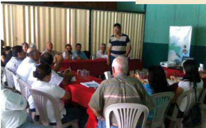
Talleres sobre la implementación del Plan Nacional de GIRH en Costa Rica. 06/2011