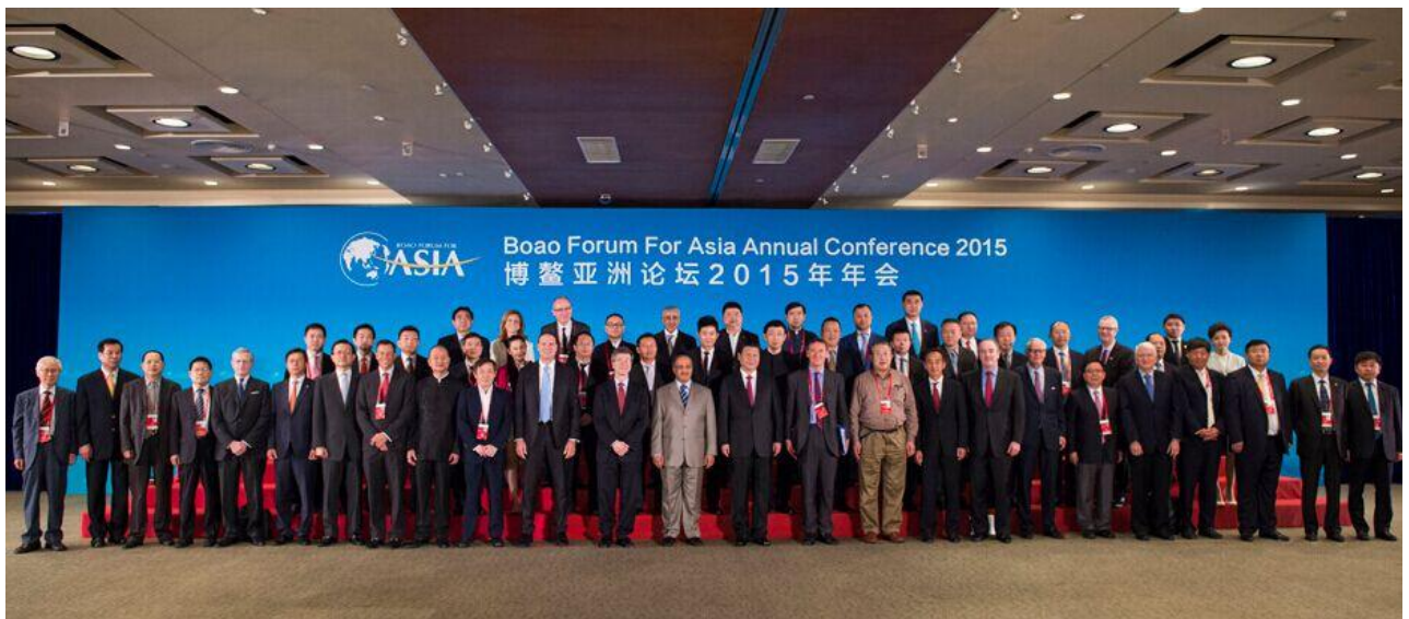
国家主席习近平与中外演讲嘉宾代表集体合影