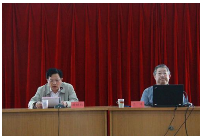
王浩院士在研讨会上做专题报告

2015年3月20日，全球水伙伴（中国福建）与福建省水利厅联合举办水生态文明专题讲座，福建省水利厅领导，机关全体公务员，直属单位和水投集团有关领导，福建水利水电设计院、水文局、水科院、水利规划院、水资源管理中心等单位技术骨干共152人参加了讲座。