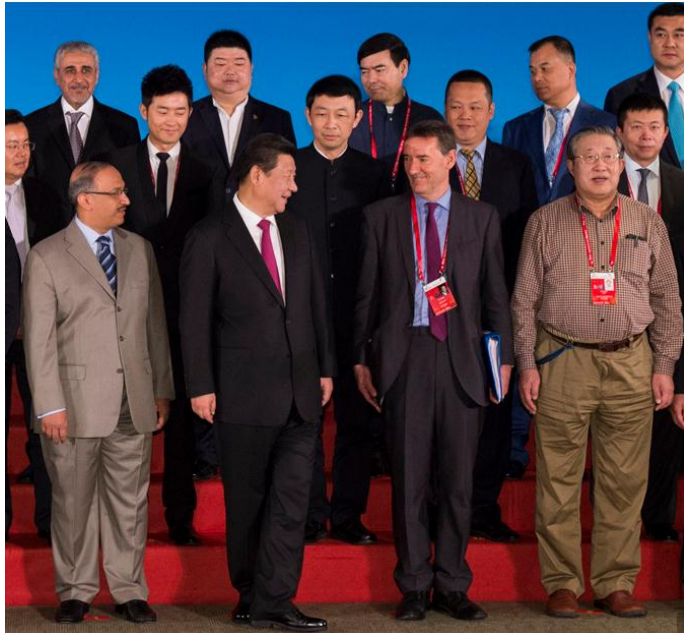
国家主席习近平与王浩院士等各国演讲嘉宾代表合影

2015年3月28日，博鳌亚洲论坛分论坛“水安全与土壤污染”在博鳌国际会议中心举行。1972年，联合国就发出警告：“水，将导致严重的社会危机”。40多年过去了，水危机不但未得到改观，反而更加严重。水，将成为21世纪危及全球的重大国际问题。