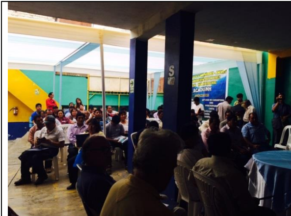
Participantes del evento, alcaldes de la Asociación de Intercomunidades Nor-Huarochiri con apoyo de PICP GWP mancomunidad