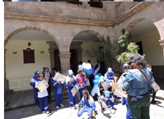
Participación en la EXPO AGUA 2015 organizado por el Gobierno Municipal de Cusco