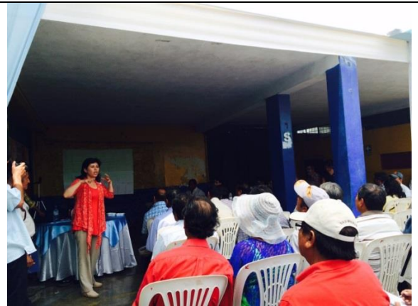
Exposicion del Centro Guaman Poma de Ayala socializando la experiencia del Centro en la facilitacion de la Mancolunidad de Municipalidades del Valle Sur de la ciudad de Cusco