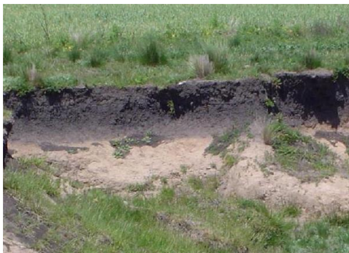
Figura 1. Pérdida de suelo por erosión hídrica superficial