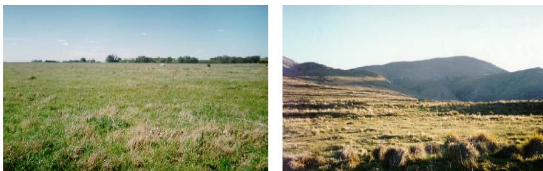
Figura 4. Ambientes de la cuenca

La cuenca abarca una región que presenta un marcado dimorfismo topográfico, presentando un área serrana con elevaciones entre 250 y 650 msnm. y otra de llanura que alcanza una cota de aproximadamente 125 msnm, donde predominan las actividades agropecuarias (Figura 4).