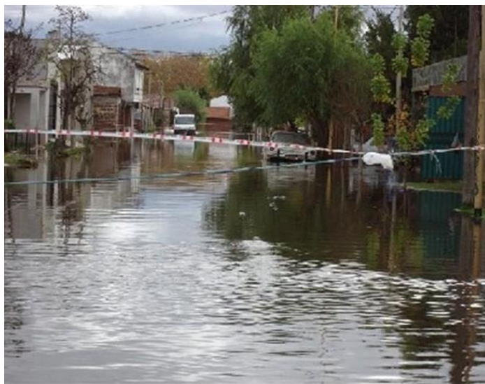
Figura 2. Área urbana inundada

a2) Sector productivo urbano, periurbano y rural con pérdida de capital productivo inmueble (infraestructura como galpones, pozos, bebidas, alambrados, tanques) y pérdida de capital productivo mueble (maquinarias como tractores, aperos, bombas, motores, electrificadores, fumigadores y animales, forraje, cosechas)